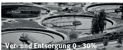
Ver- und Entsorgung 0 - 30%

Power-to-X (z.B. Wasserstoff) Terminal- & Batterieapplikationen