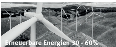
Erneuerbare Energien 30 - 60%

Elektrische Fähren Schiffe mit Alternativenantrieben