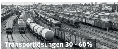
Transportlösungen 30 - 60%